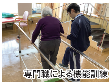
専門職による機能訓練