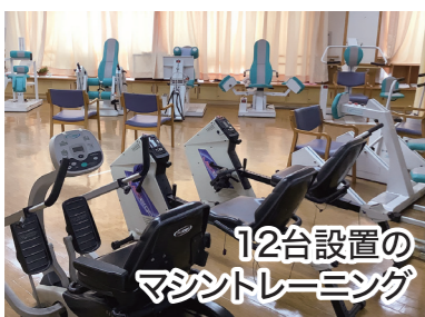
12台設置の マシントレーニング

ご自宅から通いながら、アットホームな雰囲気の中で、入浴・食事・レクリエーション・機能訓練などのサービスを行っています。