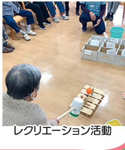
レクリエーション活動