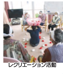
レクリエーション活動