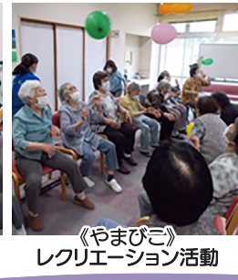
《やまびこ》 レクリエーション活動