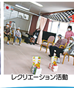
レクリエーション活動