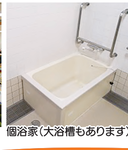
個浴家(大浴槽もあります)