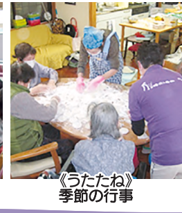
《うたたね》 季節の行事