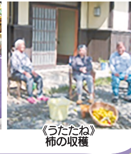
《うたたね》 柿の収穫