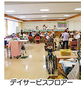
デイサービスフロア