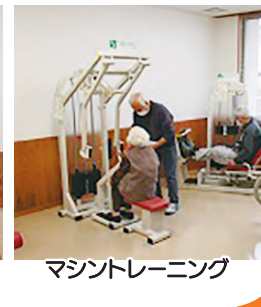
マシントレーニング