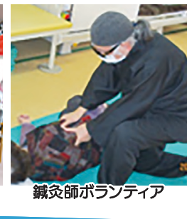
鍼灸師ボランティア