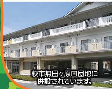
萩市無田ヶ原口団地に 併設されています。

萩市無田ヶ原口団地の中に「デイサービスおとずれ」があります。入浴や食事など日常生活上の支援と機能訓練・歩行訓練と併せて、ご利用者様同士の交流で気分転換や心身機能の活性化のお手伝いをします。対象者は、要支援・要介護・事業対象者の認定を受けている方、その他にも、閉じこもりがちな方、体力が落ちてきて心配な方なども利用できます。