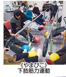
《やまびこ》 下肢筋力運動